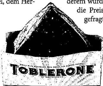
„Plundergebäck mit Honig, Mandeln und Nougat“ schafft weniger Kaufimpuls als „Plunder mit Toblerone“.

Die Konsumenten haben ihre Kaufgewohnheiten in Zeiten der Rezession angepasst und werden sie wahrscheinlich auch in der Phase des Aufschwungs beibehalten, sagen Experten bei Nielsen. Generell gebe es kein gestiegenes Preisempfinden. Weder bei Marken noch bei Eigenmarken im Bereich Food und Non-Food reagieren die Konsumenten sensibler als noch vor zwei Jahren.