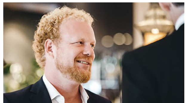
Dr. Tomáš Sedláček