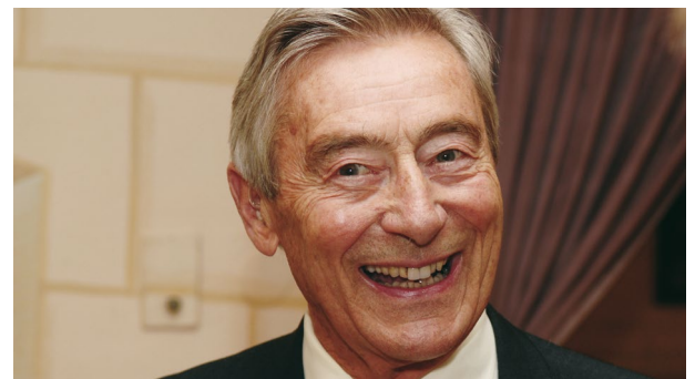
Arie de Geus