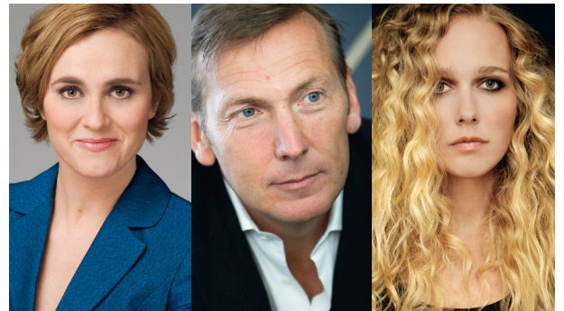
Rolf Dobelli, Caren Miosga, Prof. Michael Sandel, Katharina Wagner, Jochen Zeitz