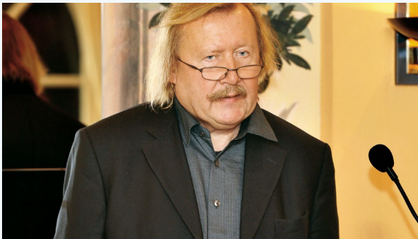
Prof. Dr. Peter Sloterdijk