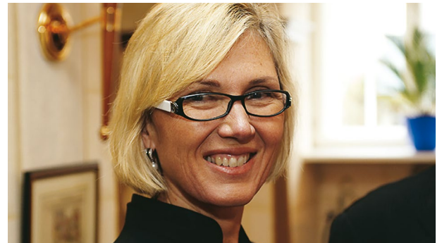
Prof. Dr. Beatrice Weder di Mauro